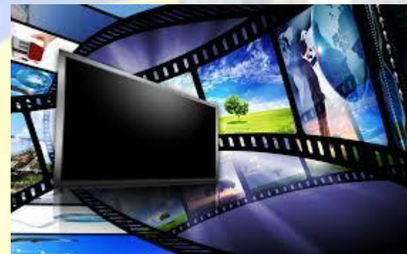
Всесвітній день телебачення