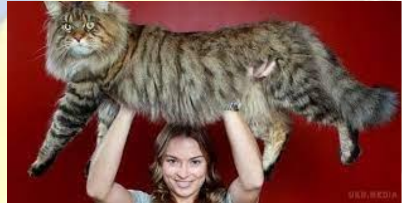
Було зафіксовано зріст самого довгого в світі домашнього кота - 102,85 см від носа до кінчика хвоста (Шотландія, 1997)