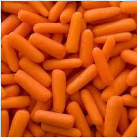
Група з 6 кухарів за час очистила та порізала 213 кг моркви – світовий рекорд (Велика Британія, 1997)