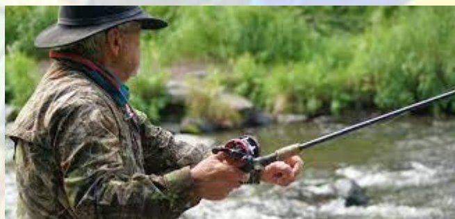
Всесвітній день рибальства