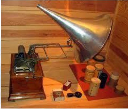
Томас Едісон оголосив про винахід фонографа (1877)