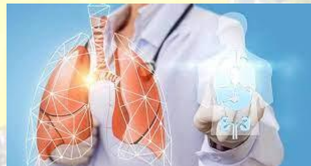
Європейський день муковісцидозу