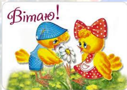
Вітаю! Всесвітній день вітань