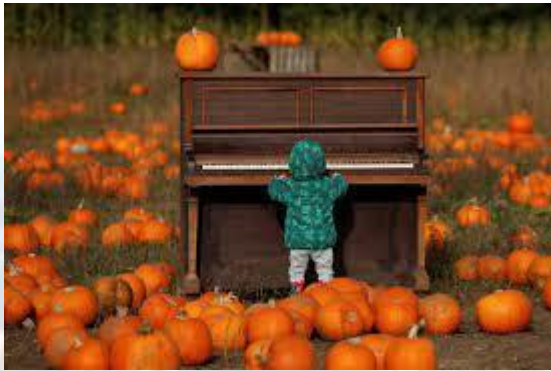
День Blasé або День пересичення