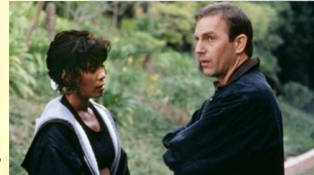
В прокат вийшла музична мелодрама «Охоронець» режисера Міка Джексона, з Вітні Г'юстон і Кевіном Костнером у головних ролях. При бюджеті стрічки $40 млн в світовому прокаті картина зібрала понад $410 млн (США, 1992)