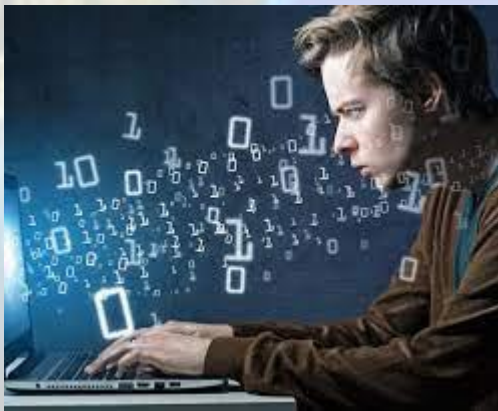
Міжнародний день системного інженера