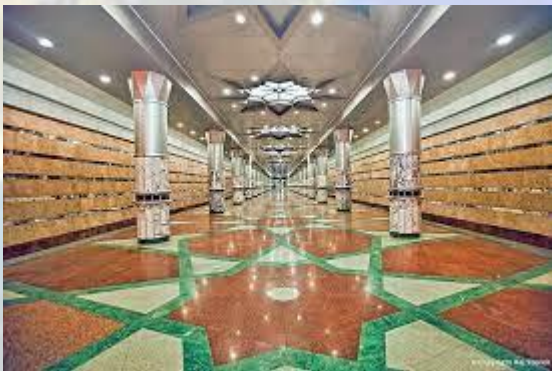
Ступив до ладу метрополітен Баку (Азербайджан, 1967)