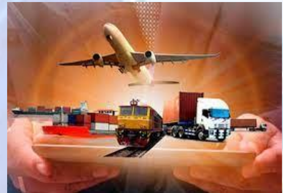
Всеукраїнський день логіста