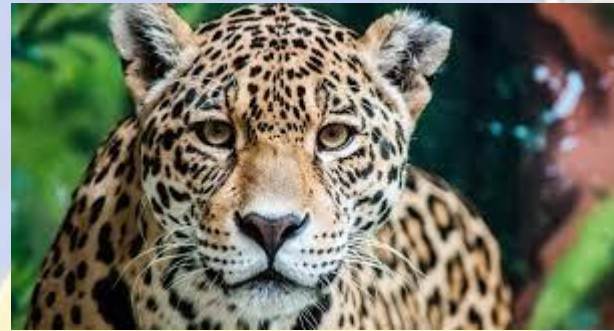
Міжнародний день ягуара