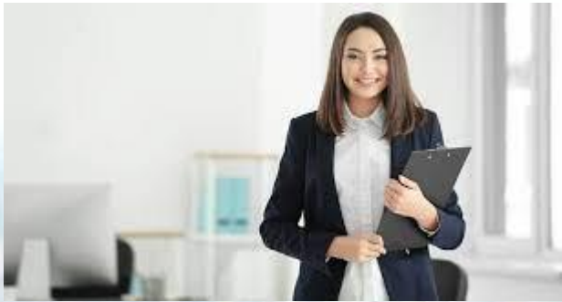
Міжнародний день жінок-правозахисників