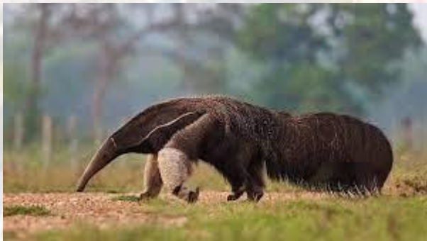
Всесвітній день мурахоїдів