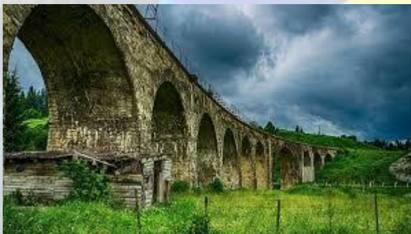
Мостодень або День мостів