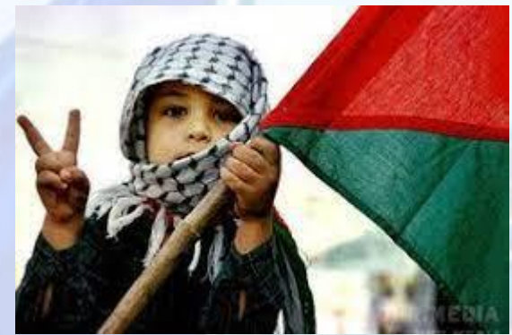
Міжнародний день солідарності з палестинським народом