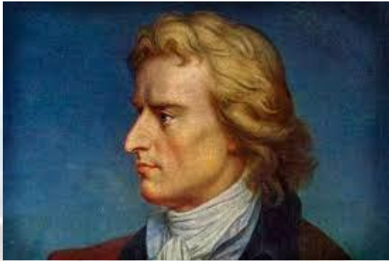
Письменник-казкар Вільгельм Гауф (Німеччина, 1802-1827)