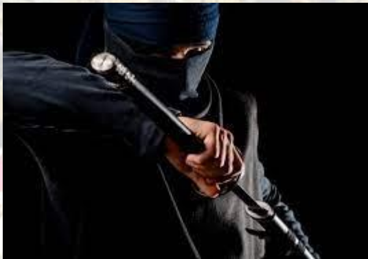
Міжнародний день ніндзя