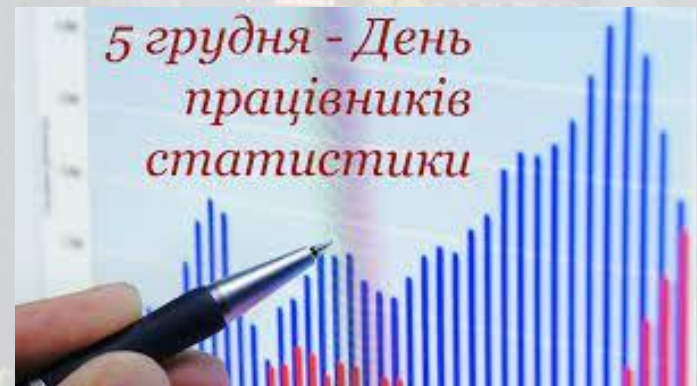
5 грудня - День працівників статистики