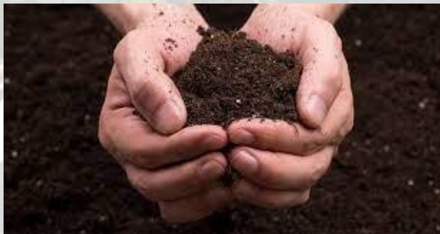
День ґрунтознавця України