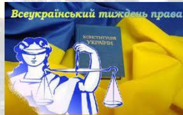
Всеукраїнський тиждень права