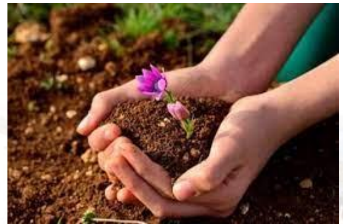
Всесвітній день ґрунтів