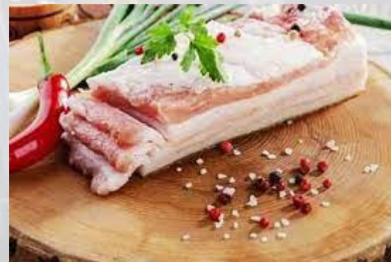
День сала (США)