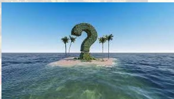
День Великого Незнання