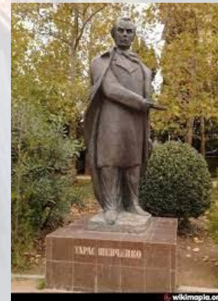
В Ялті відкрито пам'ятник Тарасові Шевченку (2007)