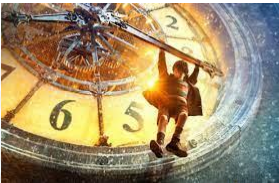
День мандрівника у часі