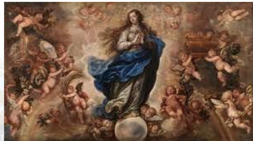
Католицьке Свято Непорочного зачаття Діви Марії