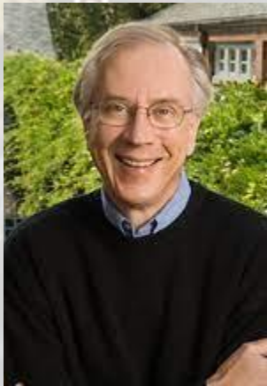
Молекулярний біолог, Нобелівський лауреат 1989 року Томас Роберт Чек (США, 1947)