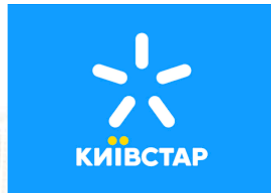
В мережі «Київстар» пролунав перший дзвоник (1997)