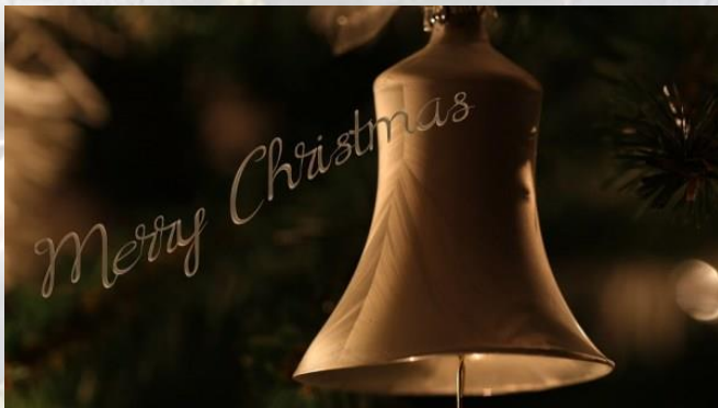
День різдвяної листівки