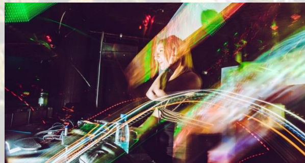
Всесвітній день техно-музики