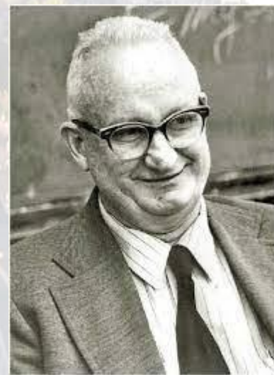
Фізик, Нобелівський лауреат 1975 року Лео Рейнуотер (США, 1917-1086)