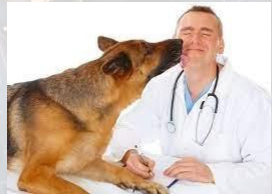
Міжнародний день ветеринарної медицини