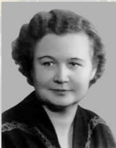
Хірург, професор Раїса Акімова (1917 - ?)