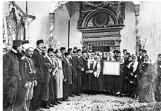
У Криму створений курултай, вищий орган кримських татар (1917)