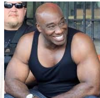
Актор Майкл Кларк Дункан (США, 1957)