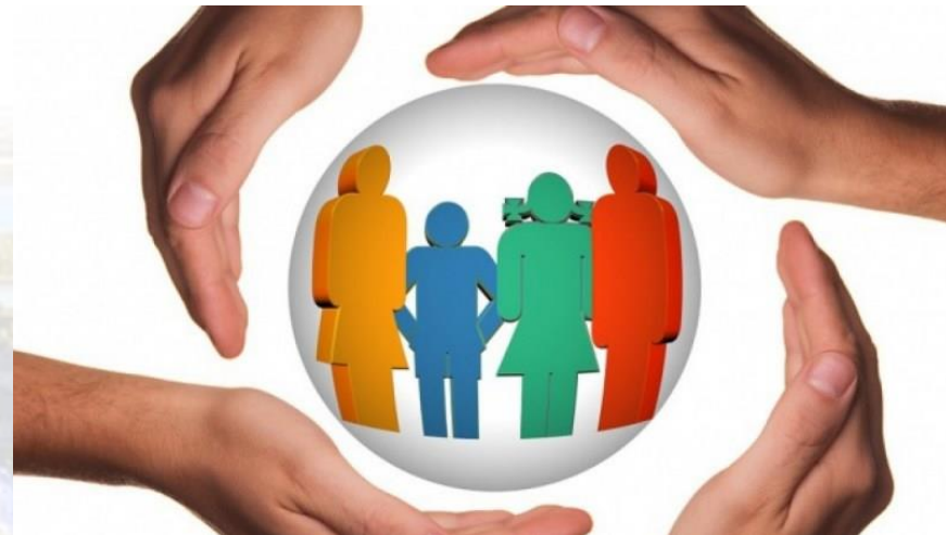
Всесвітній день прав людини