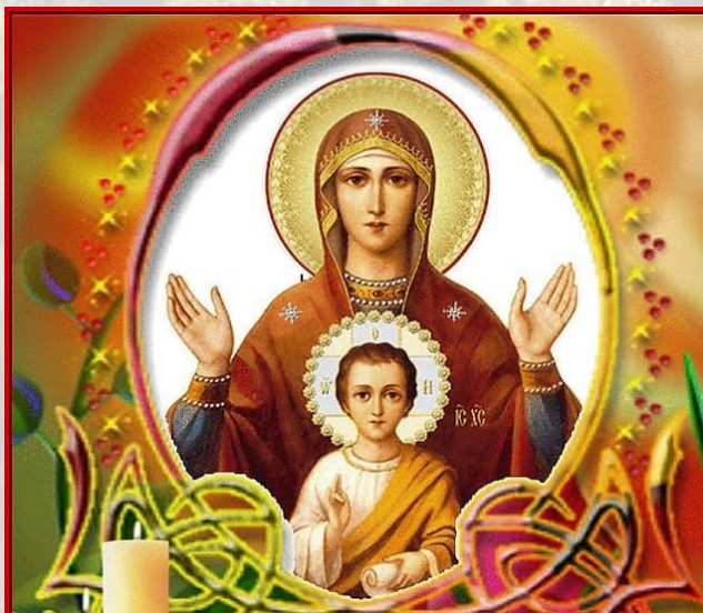
Свято ікони Божої Матері «Знамення»