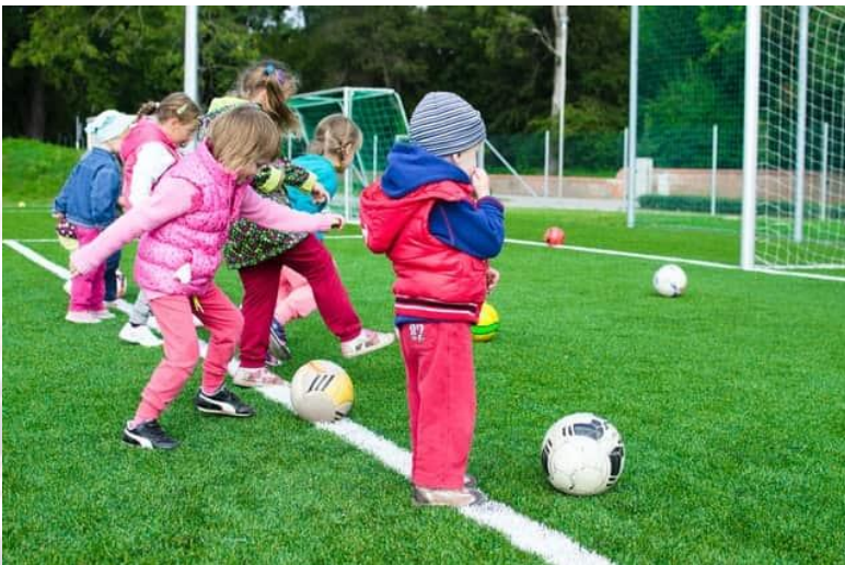
Всесвітній день футболу