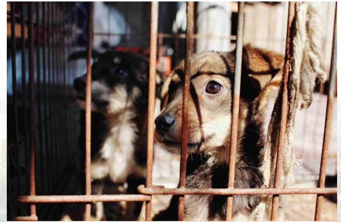
Міжнародний день прав тварин