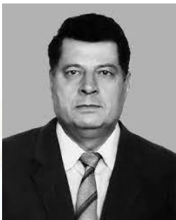
Лікар-патофізіолог, професор Едуард Гюллінг (1937)