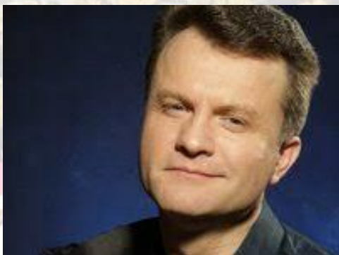
Актор театру та кіно, телеведучий В'ячеслав Василюк (1972)