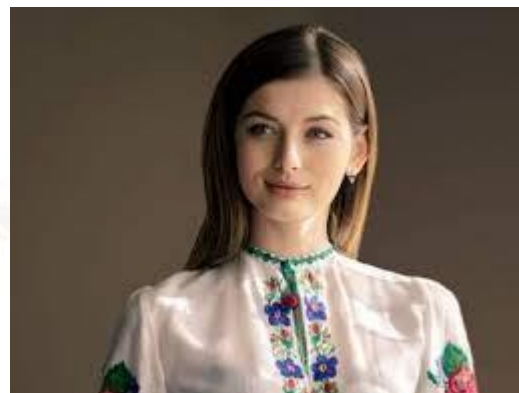
Модель («Міс Україна 2013») Ганна Заячківська (1992)