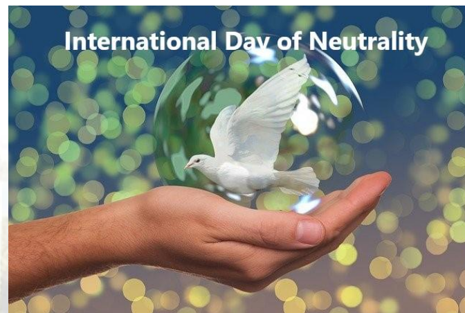
Міжнародний день нейтралітету