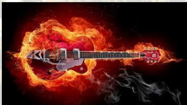
Міжнародний день хеві-металу