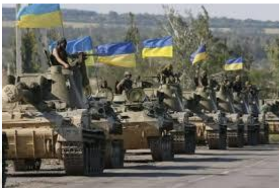
День сухопутних військ України