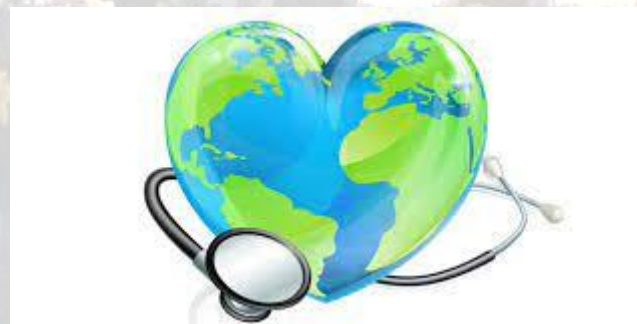
Всесвітній день загального медичного забезпечення