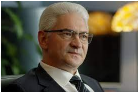
Актор театру та кіно Юрій Гребельник (1962)