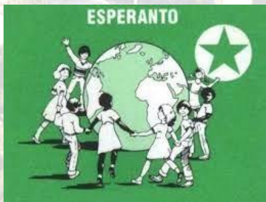
День Заменгофа або Міжнародний день есперанто