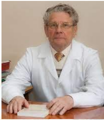
Терапевт, професор Вадим Калугін (1937)