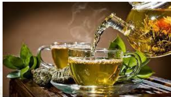
Міжнародний день чаю