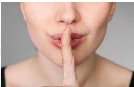
День світової тиші й німоти