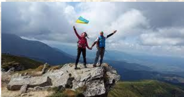
День підкорення вершин