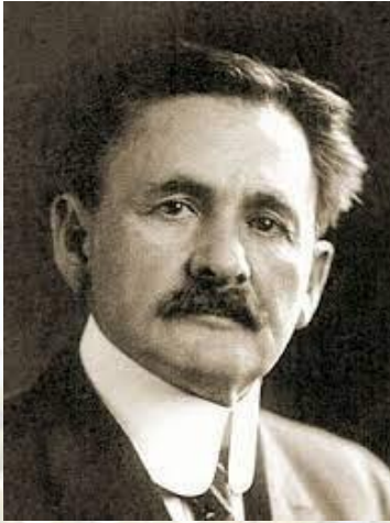
Фізик, Нобелівський лауреат 1907 року Альберт Майкельсон (США, 1852-1931)