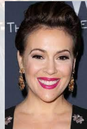
Актриса Алісія Мілано (США, 1972)