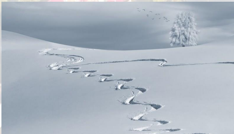
Свято глибокого снігу