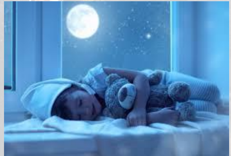
День полювання на сни