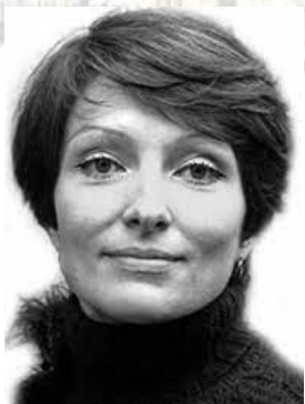
Актриса і кінорежисер Ларіса Шепітько (1938-1979)