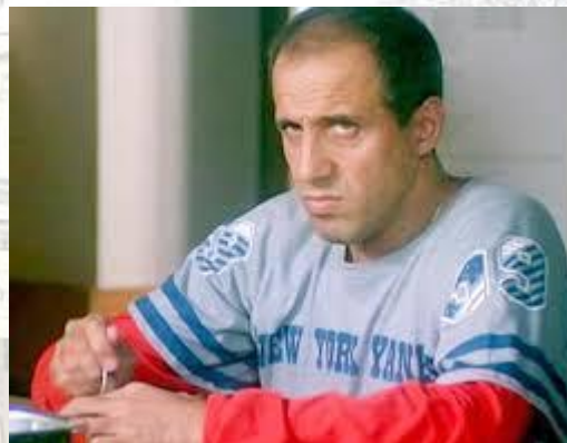
Співак, кіноактор, композитор, режисер і телеведучий Адріано Челентано (Італія, 1938)