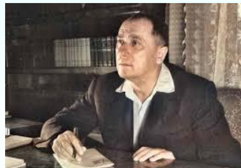
Поет, один з найяскравіших ліриків в українській літературі Володимир Сосюра (1898-1965)