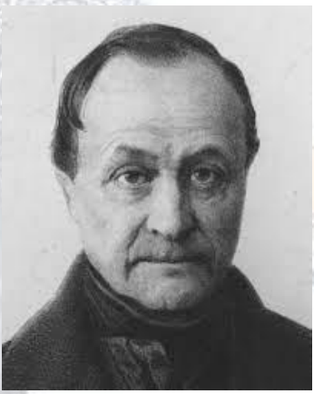
Філософ, родоначальник позитивізму, основоположник соціології, як самостійної науки Огюст Конт (Франція, 1798-1857)