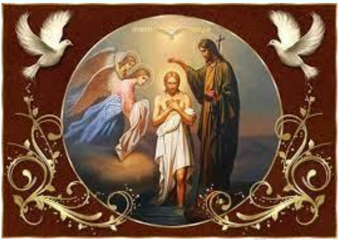
Свято Богоявлення (Водохреща)