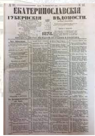
Засновано газету «Екатеринославские губернские ведомости» (1838)