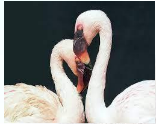
День ніжності до всіх істот