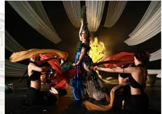
День танцю «Семи вуалей»