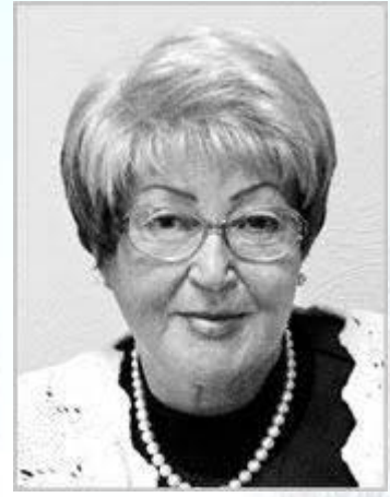
Провізор, професор Алла Березнякова (1938)