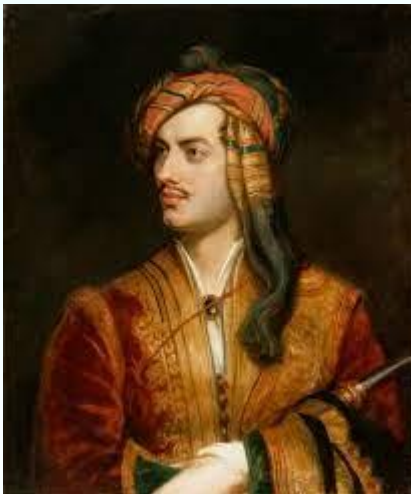
Поет Джордж Гордон Байрон (Англія, 1788-1824)