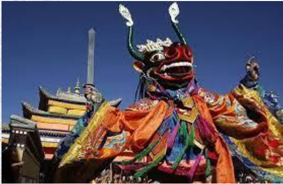
Сагаалган (Буддійський Новий рік)