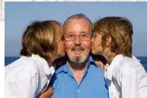
День дідуся (Польща)