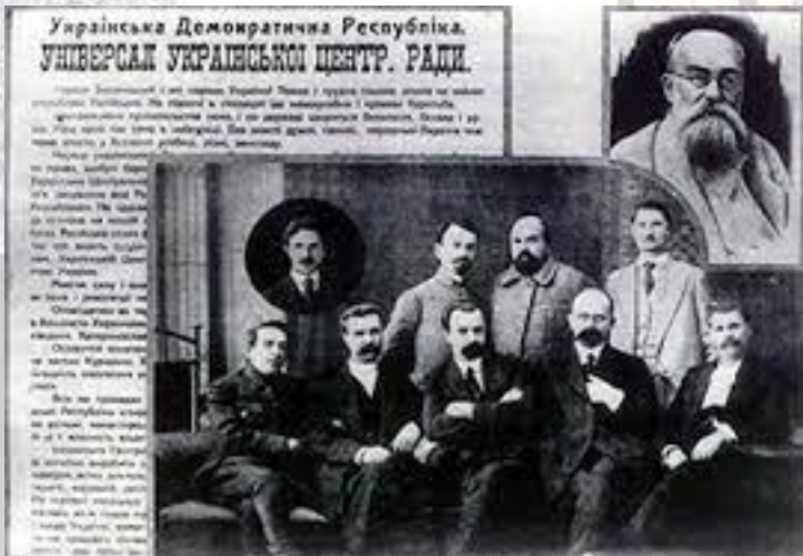
Центральною Радою затверджено IV Універсал, що проголосив Україну незалежною державою (1918)