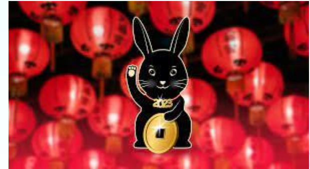
Китайський Новий рік