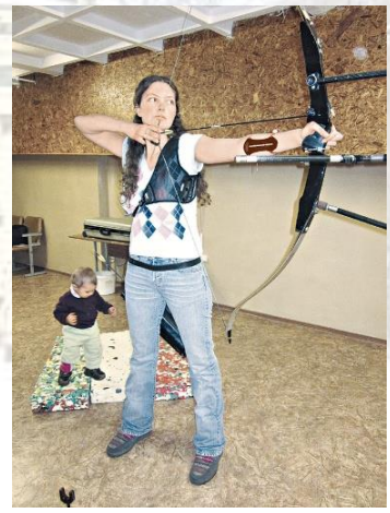
Спортсменка, віцечемпіонка Олімпійських ігор (2000 рік) зі стрільби з лука Катерина Сердюк (1983)