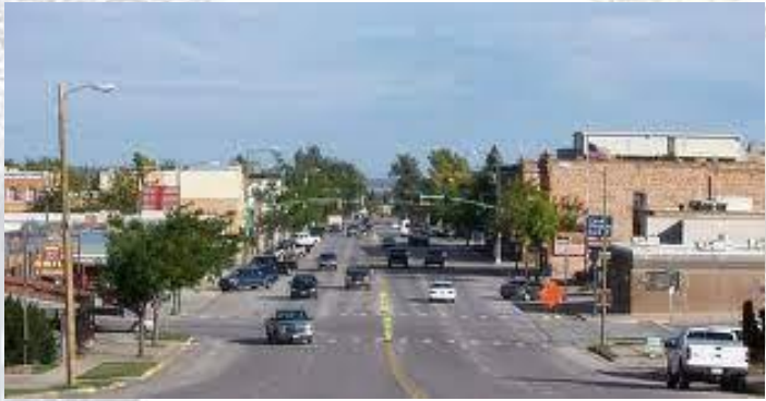
В містечку Спірфіш (штат Південна Дакота) о 7.30 ранку температура повітря за дві хвилини піднялася з -20 градусів Цельсія до +7 (США, 1943)