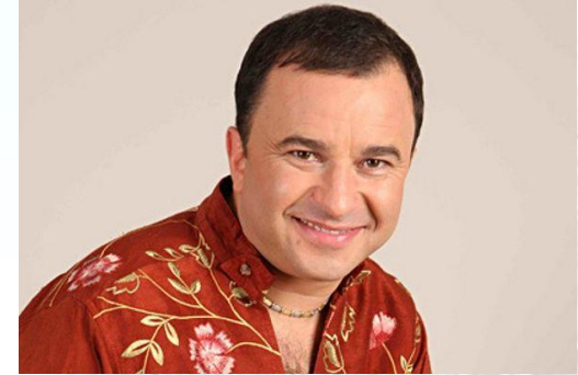
Співак Віктор Павлик

30 СІЧНЯ відносини, допомагає знайти щастя з коханою людиною. Особливо доброзичливий він до творчих людей. Сердолік – любовний талісман і сімейний оберіг. Він захищає сім'ю від недоброзичливців, приворотів, сварок, скандалів, привносить пристрастність і темпераментність. Зміцнює і примножує життєві сили, розвиває інтуїцію, допомагає в прийнятті рішень, притягує матеріальне благополуччя. Важливо правильно вибрати камінь. Мінерал з різними вкрапленнями надає зворотну дію.