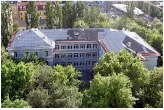
У Києві відкрилася музична школа (тепер - Київське музичне училище імені Р. Глієра) (1868)