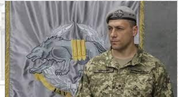
Бригадний генерал ЗСУ, командувач ССО Віктор Хоренко

У імені Віктор сильна енергетика, яка наділяє людину імпульсивністю, рішучістю, здатністю швидко запалюватися і так само швидко остигати. За характером Віктор типовий трудоголік, планомірно йде до своєї мети. Він впевнений в собі, але при цьому поблажливий до слабкостей інших. Це людина, яка, здається, тільки народившись, вже має інформацію в