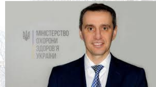
Міністр охорони здоров'я України Віктор Ляшко

30 СІЧНЯ все навколо ідеалізувати. Емоції керують Віктором , йому складно справлятися з ними, тому повинен повністю контролювати себе в поривах гніву і не допускати неврівноваженості. Він любить пожартувати, але робить це в міру, не можна з точністю стверджувати, що це завзятий дотепник. Точніше для нього підійде серйозність і власне високе почуття гідності. Характер у Віктора властива дивна риса - непотоплюваність. Він може швидко відновитися навіть після нищівного удару долі, знайти в собі сили знову радіти життю та кожному дню. Труднощі його не лякають, а загартовують. У Віктора зазвичай широке коло інтересів, тому він може бути успішним в абсолютно різних професіях. Єдине, що він не переносить, це монотонна праця. Віктор заповзятливий, терплячий, старанний, тяжіє до точних наук, здатний до вивчення іноземних мов. Чоловік вміє організовувати роботу, легко розбирається в головному, не тоне в дрібницях. Він легко домагається керівної посади, може стати хорошим викладачем, чиновником, виявити себе у творчій професії. Віктор не боїться фізичної праці, люди з таким ім'ям з успіхом працюють на фабриках, заводах, в майстернях. Але яку б професію Віктор не обрав, він завжди буде працювати на публіку, і намагатися справити враження. Він «переможець», і йому важливо, щоб всі це розуміли. Сприятливий день тижня – субота. Планета- Уран. Вдалий час року- зима. Талісманом для Віктора стануть камені селеніт або сердолік. Селеніт дарує ясність