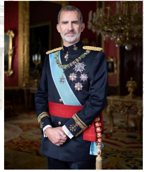
Король Іспанії, Філіп VI (Іспанія, 1968)