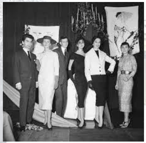
В Парижі відбувся перший показ колекції Ів Сен Лорана (Франція, 1958)