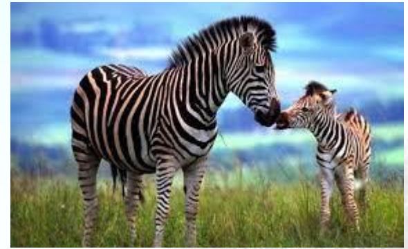
Міжнародний день зебри