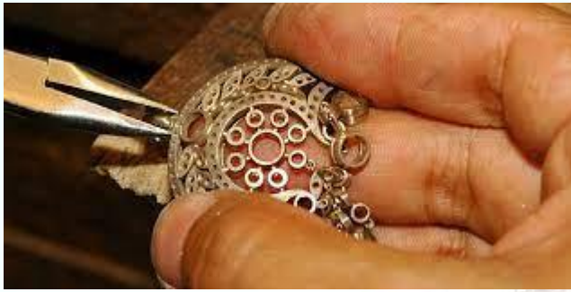
Міжнародний день ювеліра