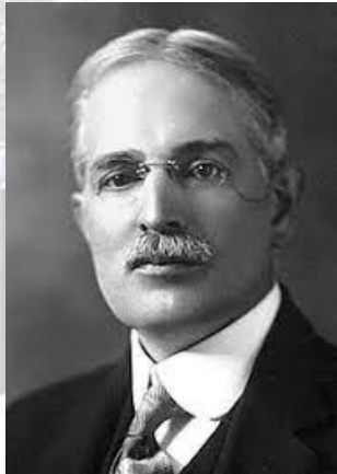
Хімік, Нобелівський лауреат 1914 року Теодор Річардс (США, 1868-1928)