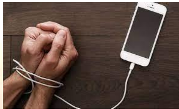
Всесвітній день без мобільного телефону