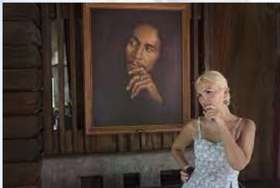
Всесвітній день Растамана або День Боба Марлі