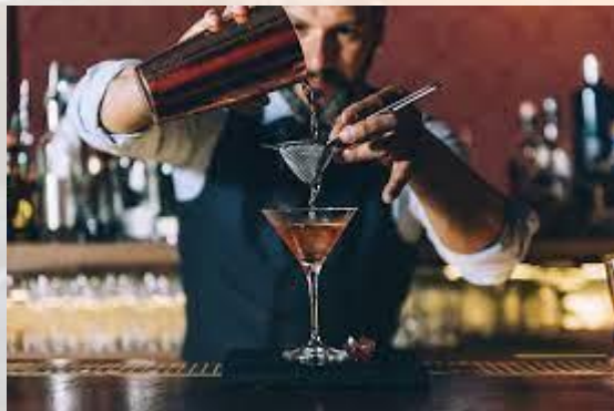
Міжнародний день бармена