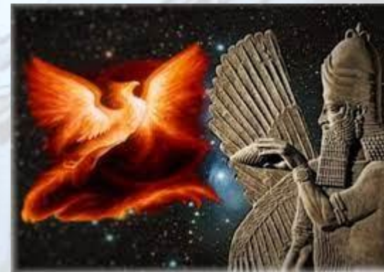
Зороастрійське свято Сраоші