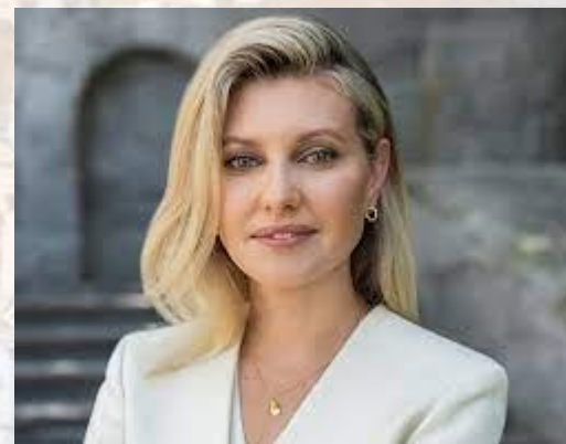
Перша леді України Олена Зеленська (1978)