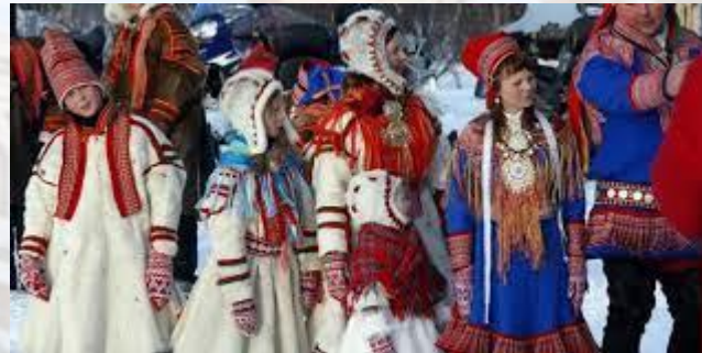
Міжнародний день саамського народу