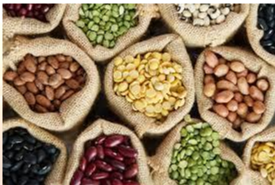
Всесвітній день зернобобових