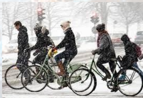
Міжнародний зимовий день «На роботу на велосипеді»