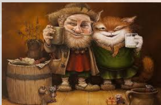
День пригощання Домового (Кудеси) та Велесичі