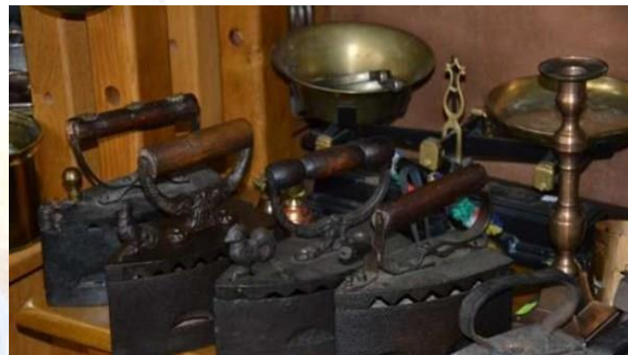
День народження праски