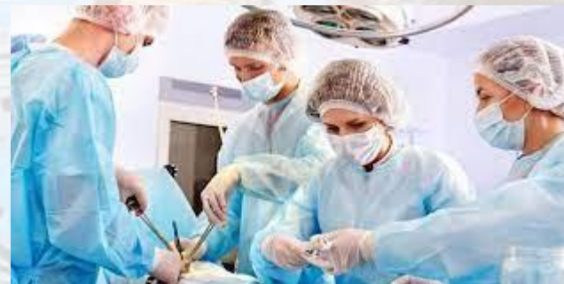
Міжнародний день операційної медичної сестри