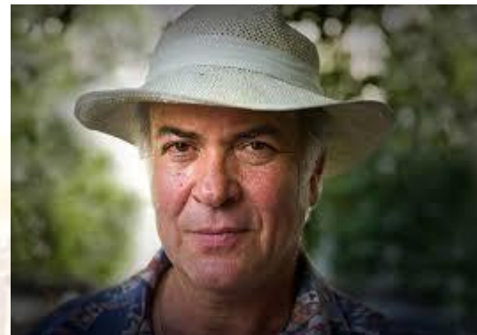
Народний артист України Анатолій Хостікоєв (1953)