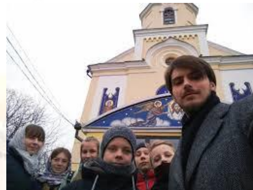
Всесвітній день православної молоді