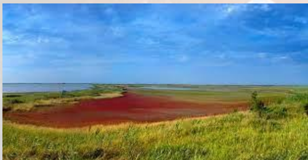
Створено "Азово-Сиваський національний природний парк" (1993)