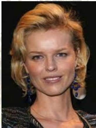
Топ-модель Ева Герцигова (Чехія, 1973)