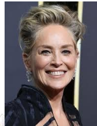
Актриса Шерон Стоун (США, 1958)