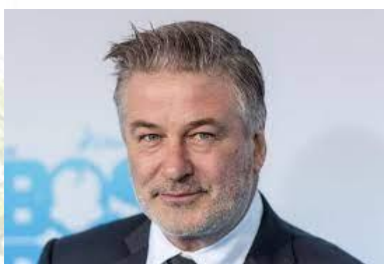
Актор Алек Болдуїн (США, 1958)