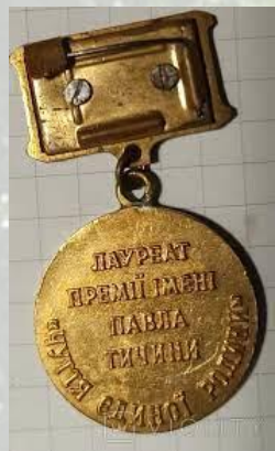
Заснована літературна премія імені Павла Тичини (1973)