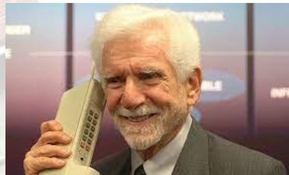
Мартін Купер з Motorola набрав конкурентів із Bell Labs. Це був перший дзвінок по стільниковому телефону (США, 1973)