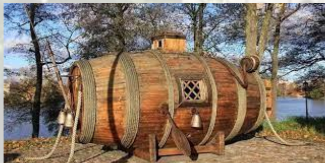
День підводного човна