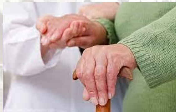
Всесвітній день боротьби з хворобою Паркінсона