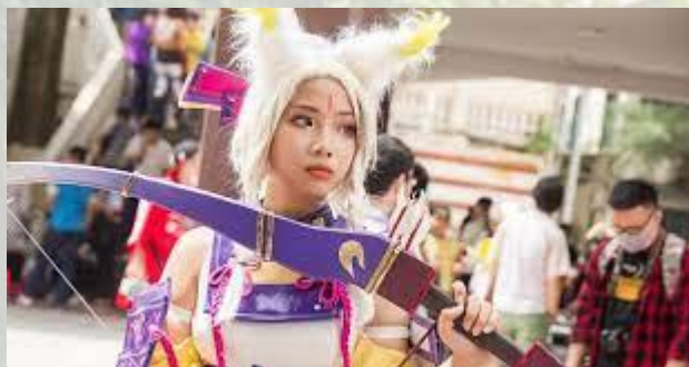
Міжнародний день анімешника