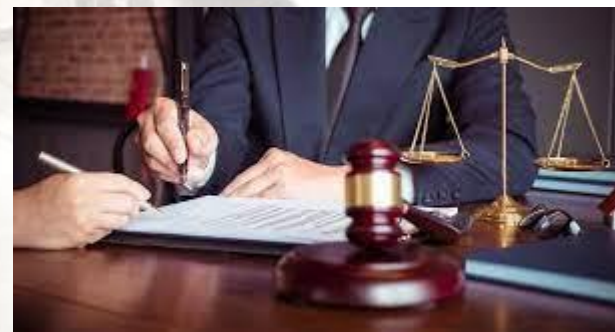
Міжнародний день «Будьте добрі до юристів»