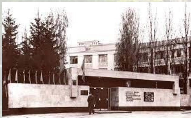
Утворено Київське вище інженерне радіотехнічне училище ППО (КВІРТУ ППО) (1953)