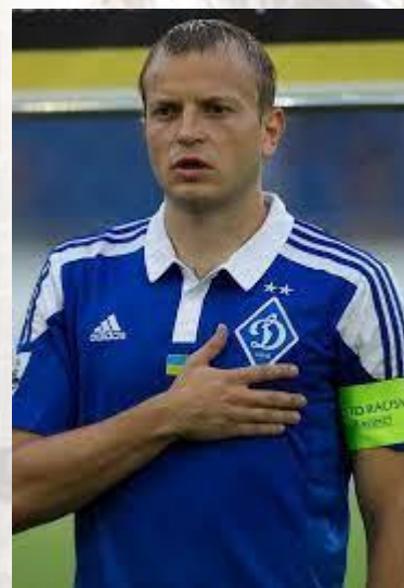
Футболіст, півзахисник «Динамо» (Київ) і національної збірної України Олег Гусєв (1983)