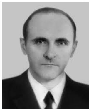
Хірург, професор Ждан Ваврик (1928)