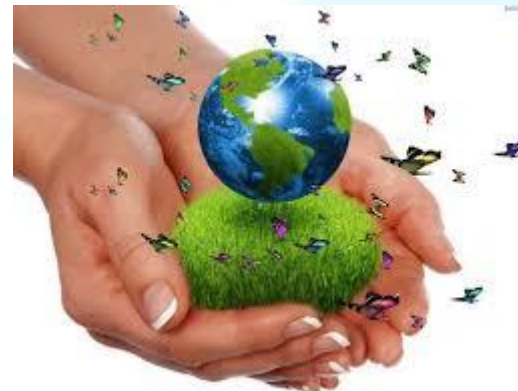
Міжнародний день захисту клімату