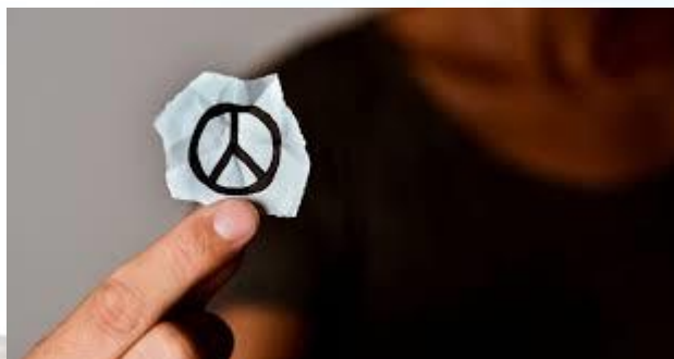
Міжнародний день відмовника від військової служби за переконаннями совісті