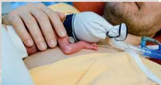
Міжнародний день обізнаності про метод «кенгуру» у виходженні недоношених дітей