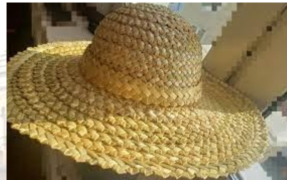
День солом'яного бриля.