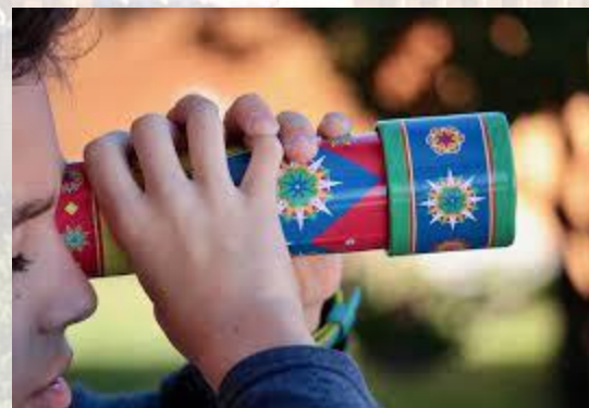
День калейдоскопів Чернівецький національний університет імені Юрія Федьковича