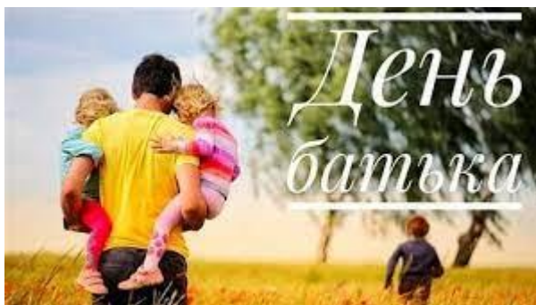
Міжнародний день батька