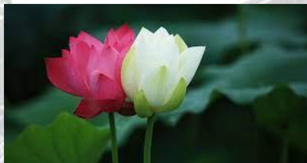
Всесвітній день гармонії