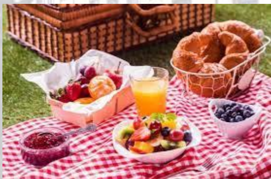
Міжнародний день пікніка