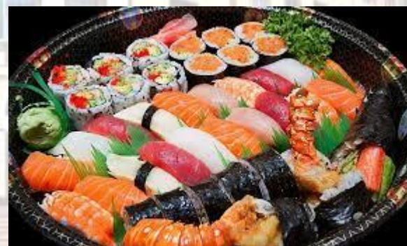
Міжнародний день суші