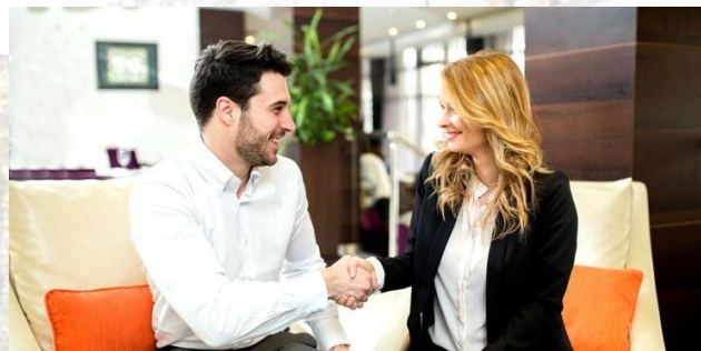
День знайомства з вашими клієнтами