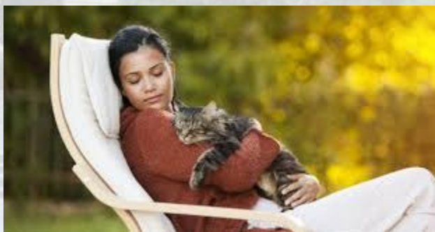
День денного сну або дрімоти