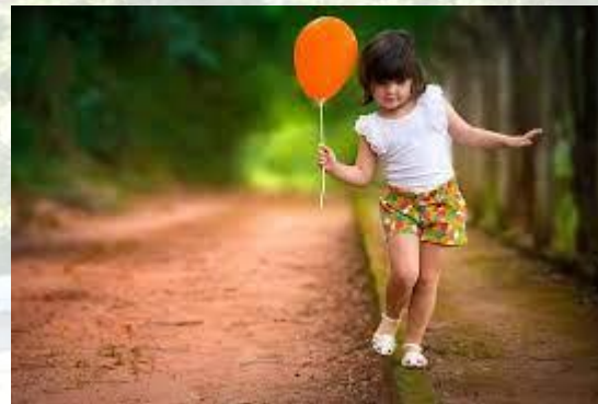
День ходіння по бордюрах