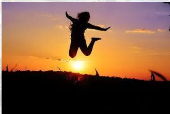
Всесвітній день стрибка