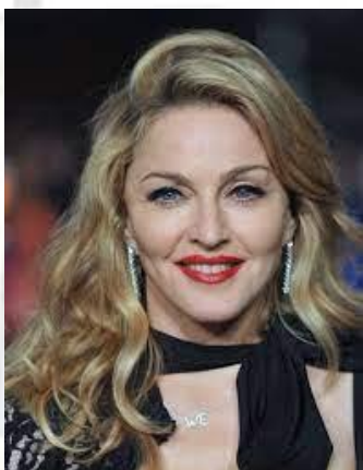
Співачка, танцівниця, кіноактриса Мадонна (США, 1958)