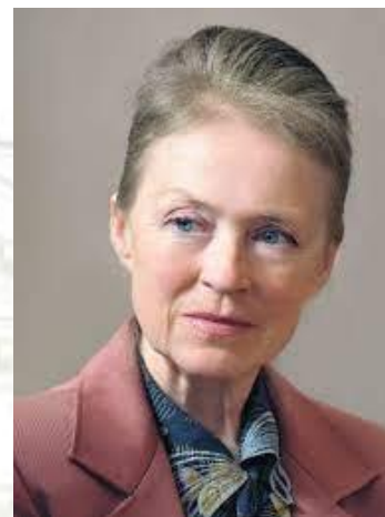
Акторка, драматург, міністр культури України (1991-1992) Лариса Хоролець (1948-2022)