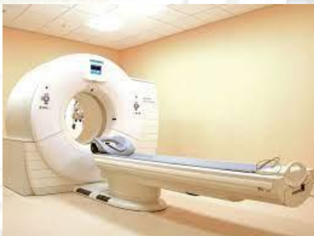
Зроблено перший знімок томографом (інструмент медичної техніки для докладної візуалізації внутрішніх структур і органів людини) (1973)