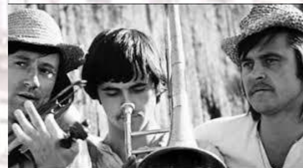
День перегляду чорнобілого фільму