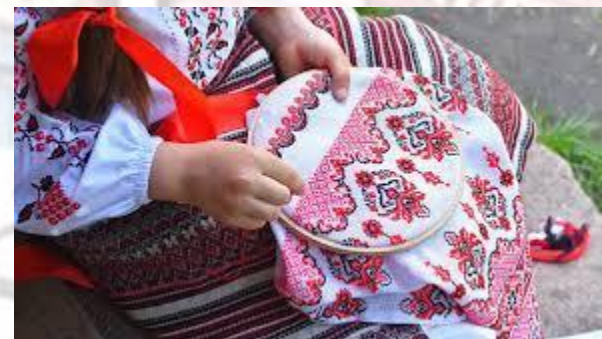
Міжнародний день вишивальниць