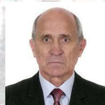
Кардіолог, професор Семен Білецький (1943)