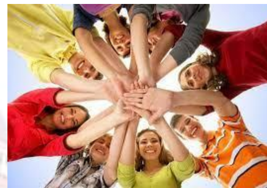
Всесвітній день молоді