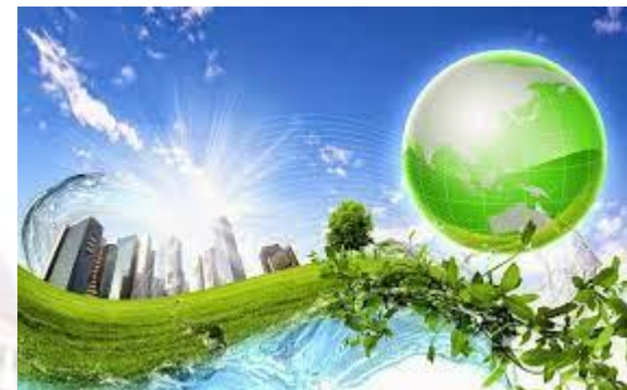
Всесвітній день географічних інформаційних систем