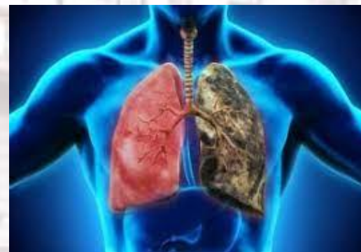
Всесвітній день боротьби проти хронічного обструктивного захворювання легень