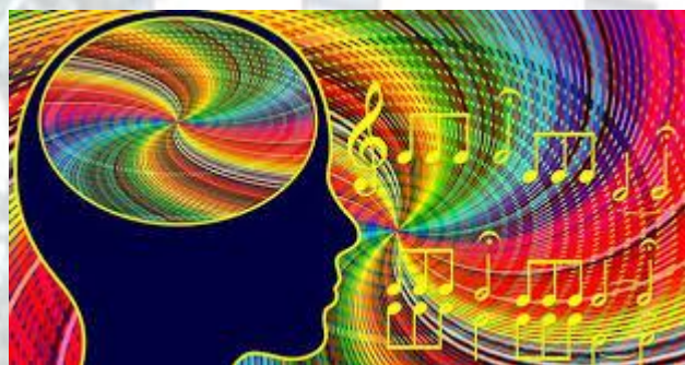
Європейський день музичної терапії