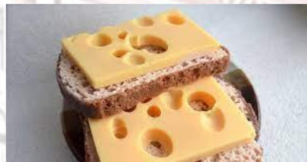
Міжнародний день сиру і хліба