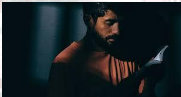
Міжнародний день письменників, які знаходяться в ув'язненні