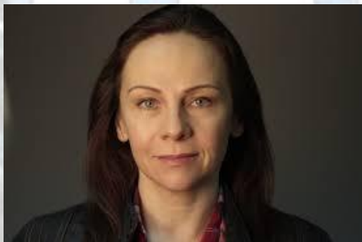
Актриса театру та кіно Олена Узлюк (1968)