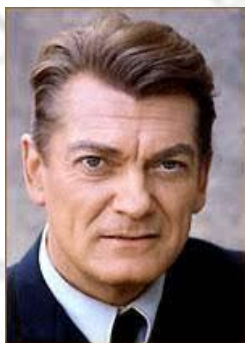
Кіноактор Жан Марє (Жан Вілен- Марє) (Франція, 1913-1998)