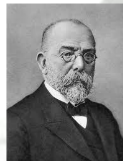
Мікробіолог, Нобелівський лауреат 1905 року Роберт Кох (Німеччина, 1843-1910)