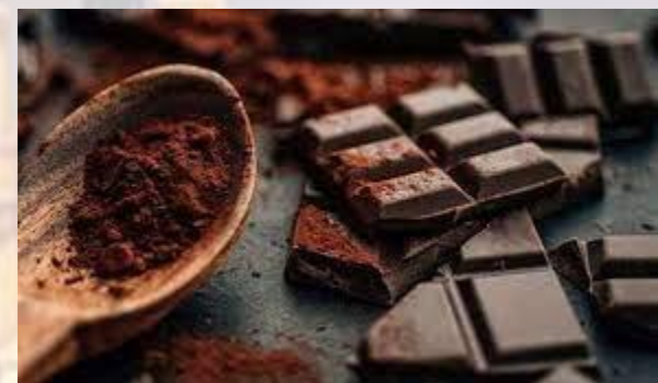
День гіркого шоколаду