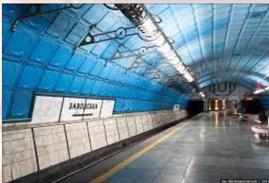
Всесвітній день метро