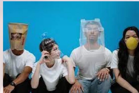
День своєрідних людей