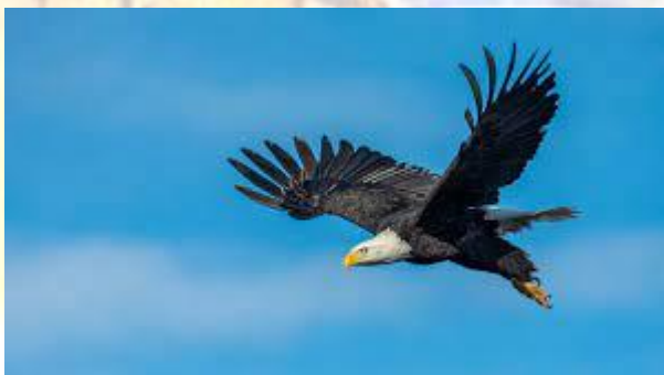
День порятунку орлів