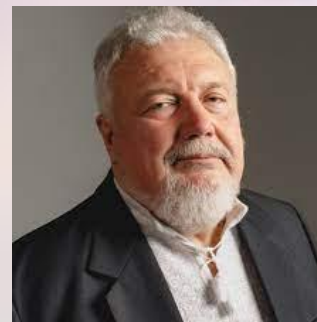
Педіатр, член – кореспондент АМНУ, професор Олександр Сміян (1929)