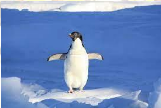
День навчання танцям пінгвінів