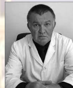
Лікар-комбустіолог, професор Григорій Олійник (1954)