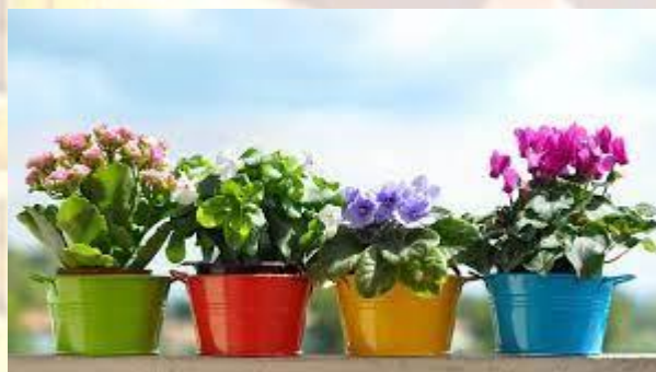
День шанування кімнатних рослин