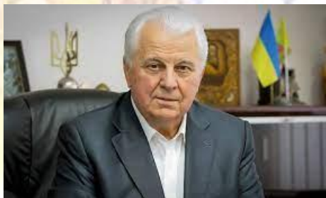
Перший президент незалежної України Леонід Кравчук (1934-2022)