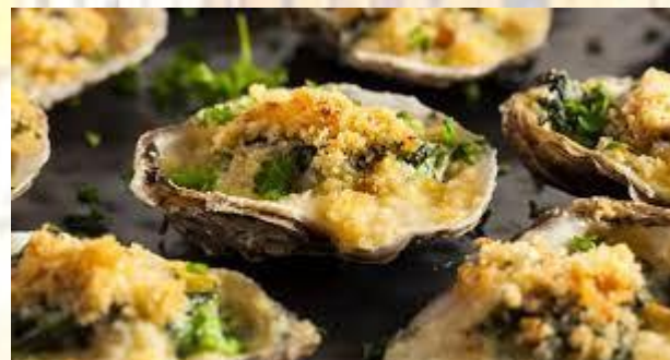
День устриць Рокфеллера