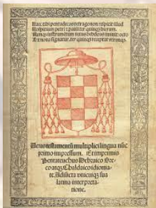
В Іспанії надруковано книгу Комлютенська Поліглотта – перше багатомовне видання Біблії (1514)