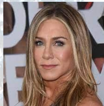
Кіноакторка Дженіфер Еністон (США, 1969)