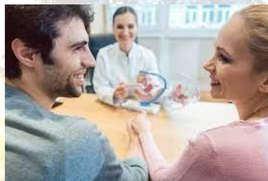
День сексуального і репродуктивного здоров'я