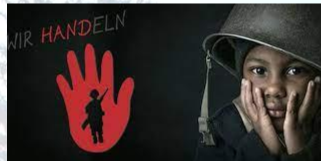
Міжнародний день дітей-солдатів (День Червоної руки)