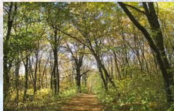
День прокладання стежок