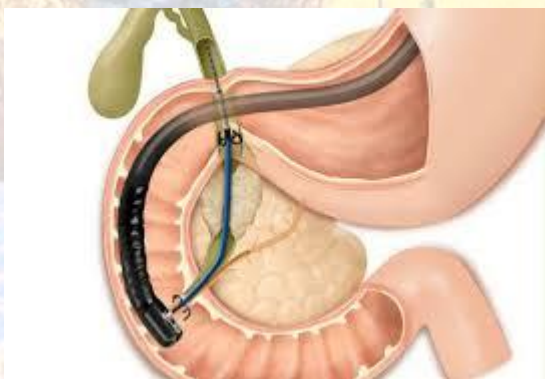
Всесвітній день холангіокарциноми