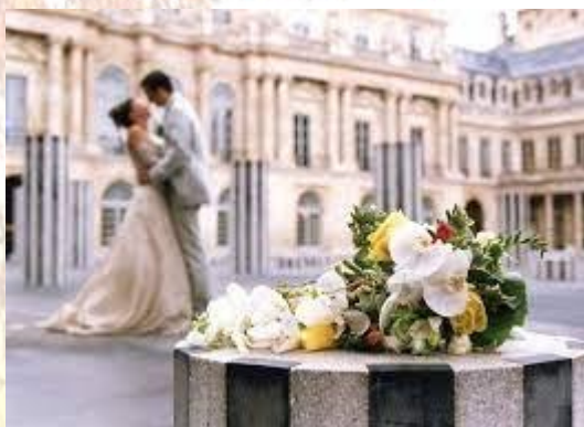
Міжнародний день шлюбних агентств