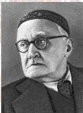
Мікробіолог, епідеміолог, академік Микола Гамалія (1859- 1949)