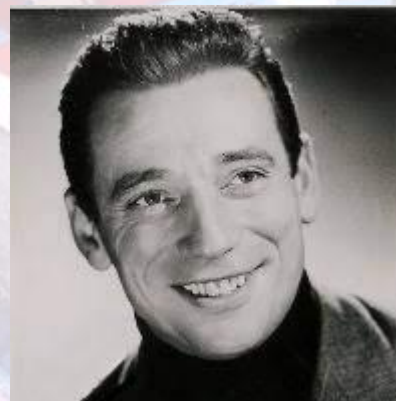
В концертному залі "АВС" в Парижі дебютував 22-річний співак Ів Монтан. Величезну роль у професійному становленні співака зіграла зустріч з Едіт Піаф. (Франція, 1944)