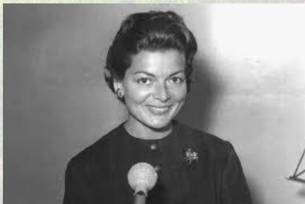
Співачка, переможниця першого конкурсу пісні Євробачення 1956 року Ліз Ассія (Швейцарія, 1924-201)