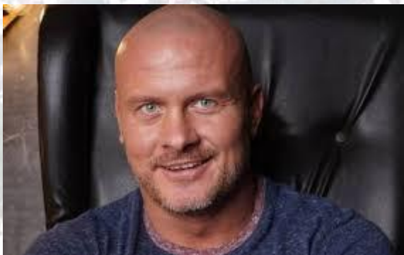
Боксер-професіонал В'ячеслав Узелков (1979)