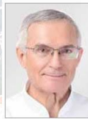
Хірург, професор Володимир Клименко (1949)