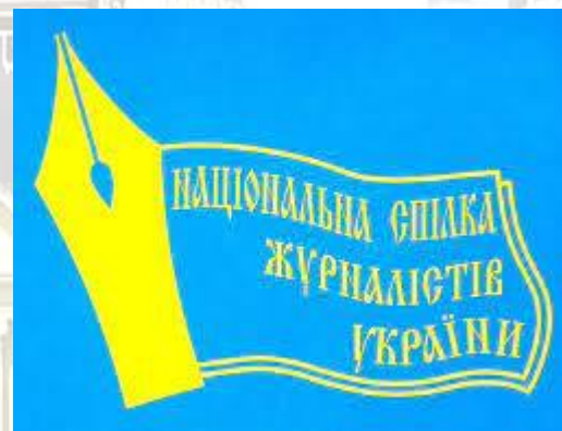
Утворено Спілку журналістів України (1959)