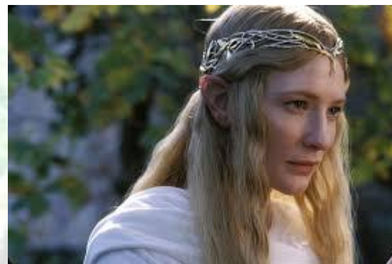
Кіноактриса («Єлизавета», «Талановитий містер Ріплі», «Володар кілець») Кейт Бланшетт (Австралія, 1969)