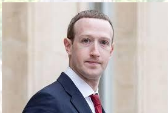
Бізнесмен, засновник соціальної мережі "Фейсбук". "Людина року" - 2010 за версією журналу "Тайм". Один із наймолодших мультимільярдерів (7 млрд. дол. у 2010 р.) Марк Цукерберг (США, 1984)