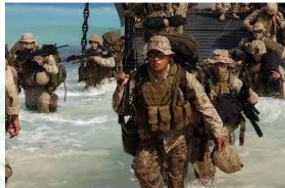
День морської піхоти України