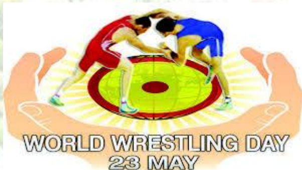
Всесвітній день спортивної боротьби