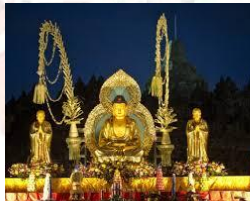
Весак(день народження Будди)