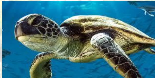
Всесвітній день черепахи