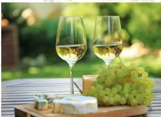
Міжнародний день Шардоне