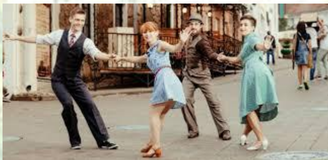
Всесвітній день лінді-хопу