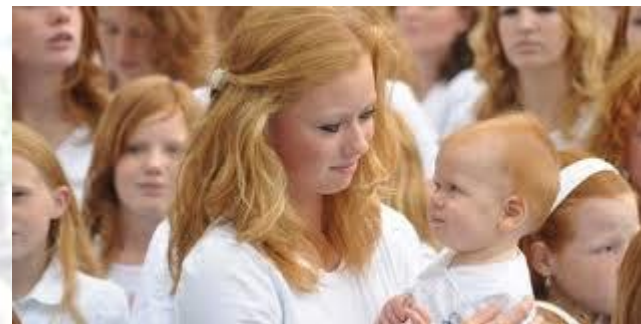
Всесвітній день рудих