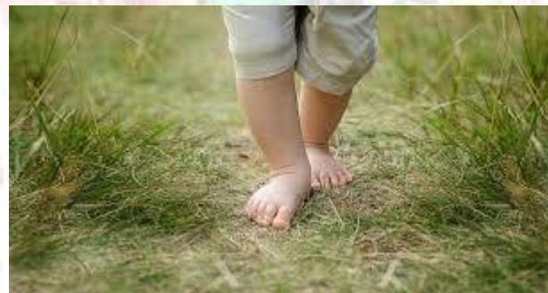
День ходіння босоніж