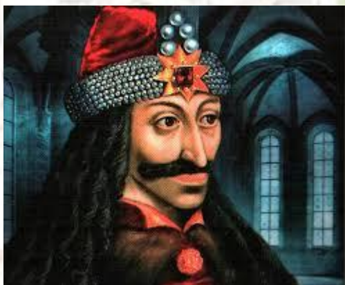
Всесвітній день Дракули