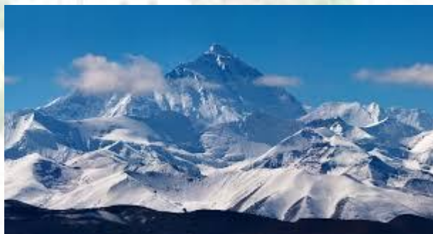
Міжнародний день Евересту