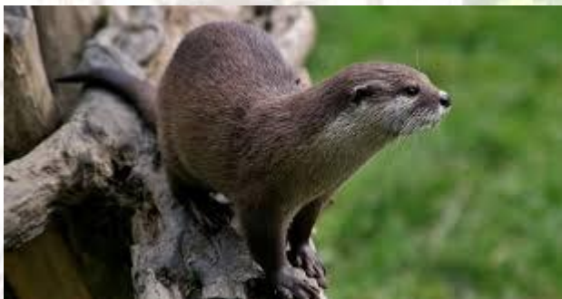
Всесвітній день видри