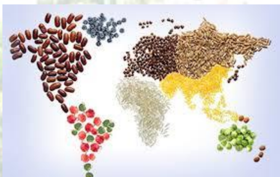
Всесвітній день здорового травлення