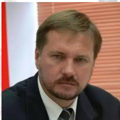
Політик, народний депутат України III-VI скликань Тарас Чорновіл (1964)