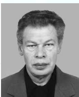
Патофізіолог, професор Юрій Ібрагімов (1939)