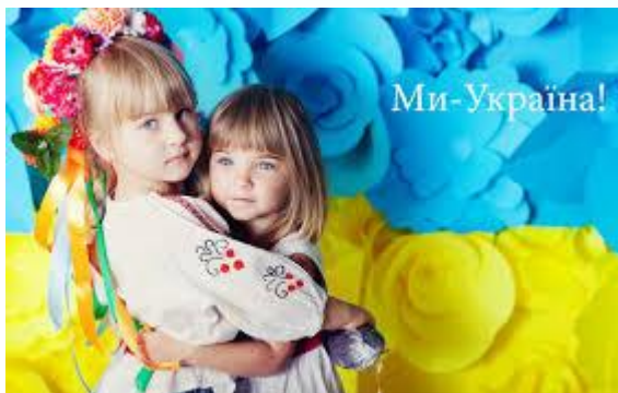
Міжнародний день захисту дітей