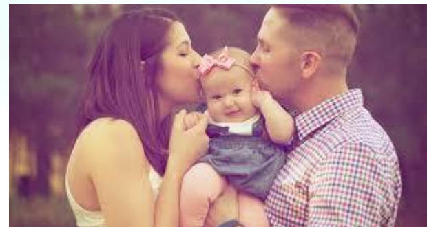
Всесвітній день батьків