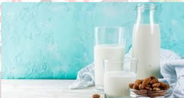
Всесвітній день молока