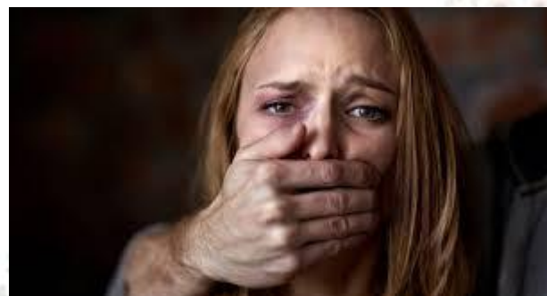
Всесвітній день нарцисичного насильства