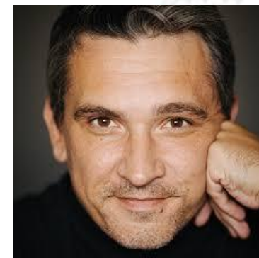
Актор театру та кіно Сергій Кисіль (1984)