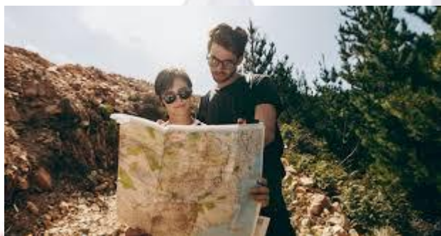
Всесвітній день відповідального туризму