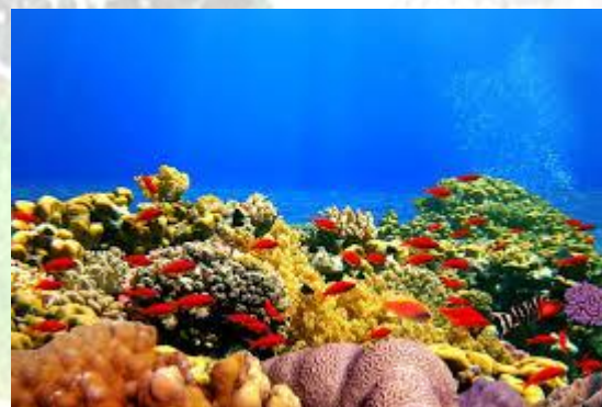
Всесвітній день рифа