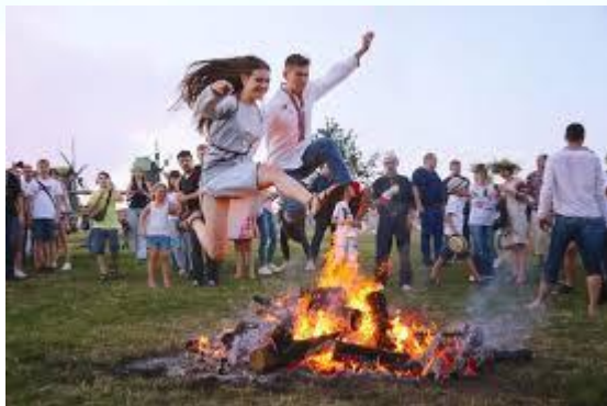
Свято Івана Купала