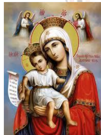
Свято ікони Божої Матері «Достойно є»