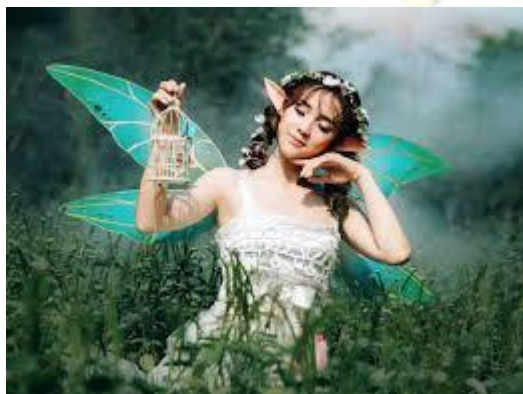
Міжнародний день феї