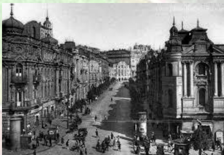
Столиця радянської України повернута з Харкова в Київ (1934)