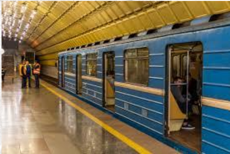
Всесвітній день метро