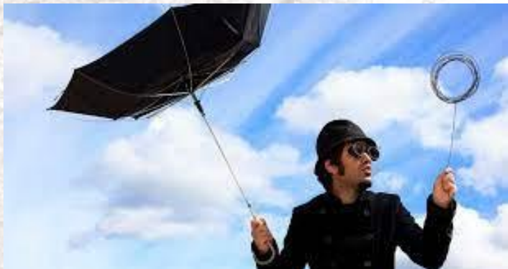
День своєрідних людей