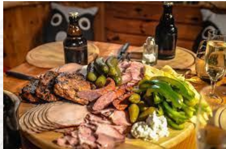
Домочадців день (Різдвяний м'ясоїд)