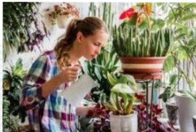
День подяки кімнатним рослинам (США)