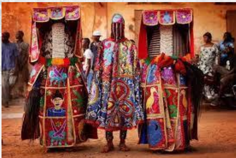
День вуду (Бенін)