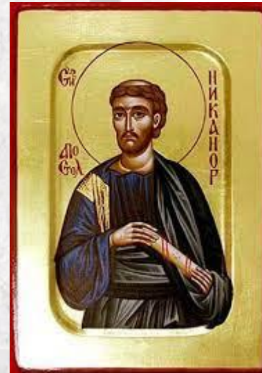
День пам'яті святого апостола Никанора