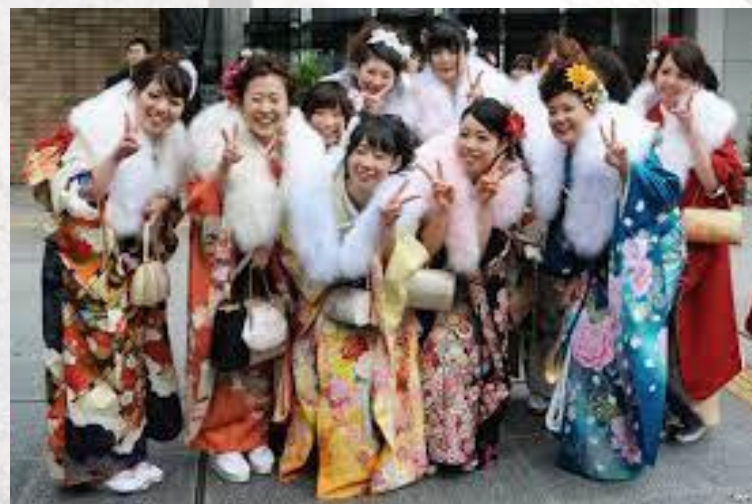
День повноліття (Японія)