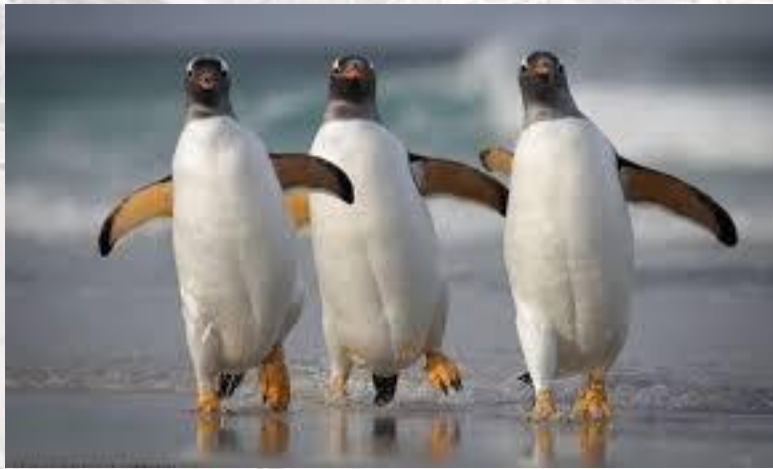
День навчання танцям пінгвінів