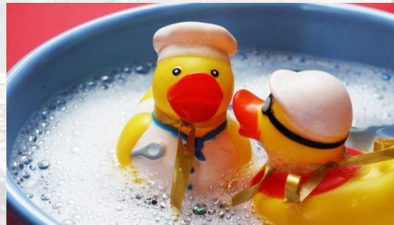
День гумового каченяти