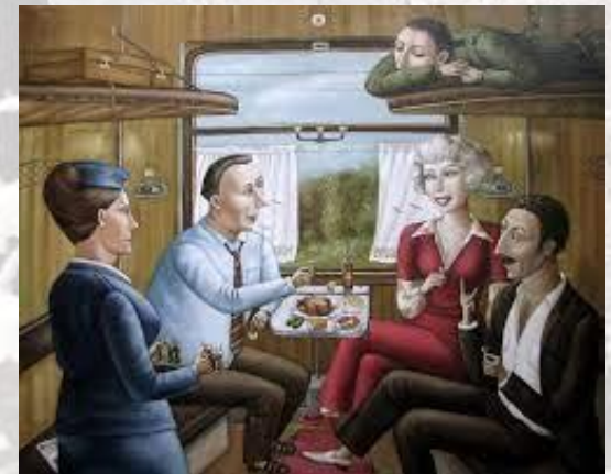
День випадкових попутників