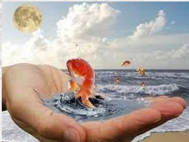
День здійснення мрії