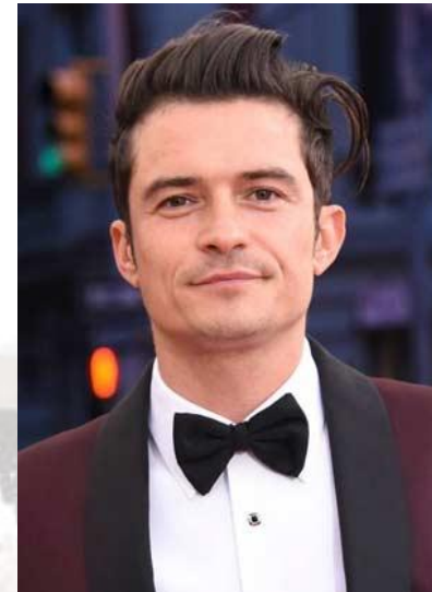
Кіноактор Орландо Блум (Великобританія, 1977)