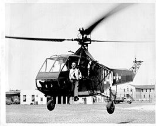
Вперше піднімається в повітря вертоліт Сікорського, призначений для військових потреб(1942)