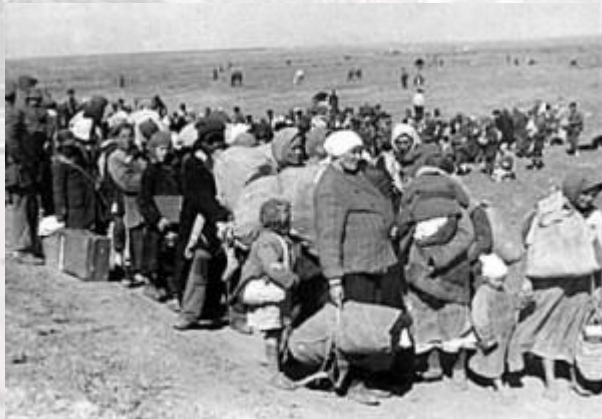
Почалося примусове вивезення населення України в Німеччину (остарбайтери) (1942)