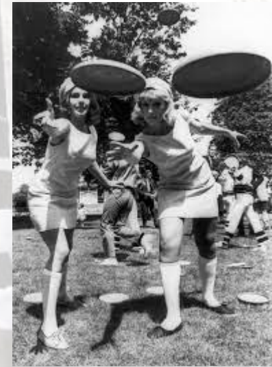
Американська фірма Wham-O Company випустила на ринок нову іграшку, створену Уолтером Моррісоном, - літаючу тарілку («фрисбі») (1957)